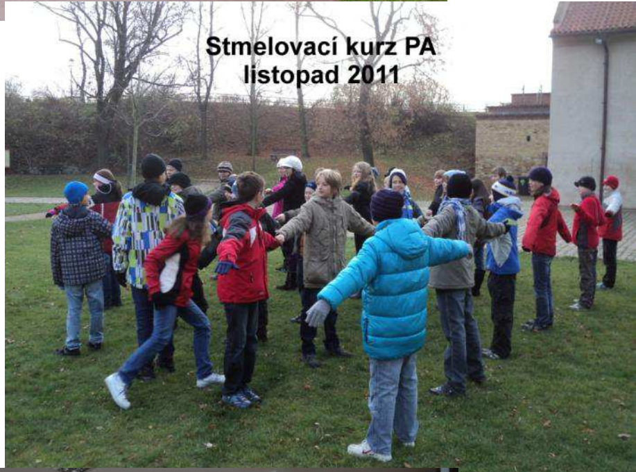
Stmelovací kurz PA listopad 2011