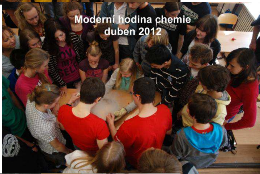
Moderní hodina chemie duben 2012