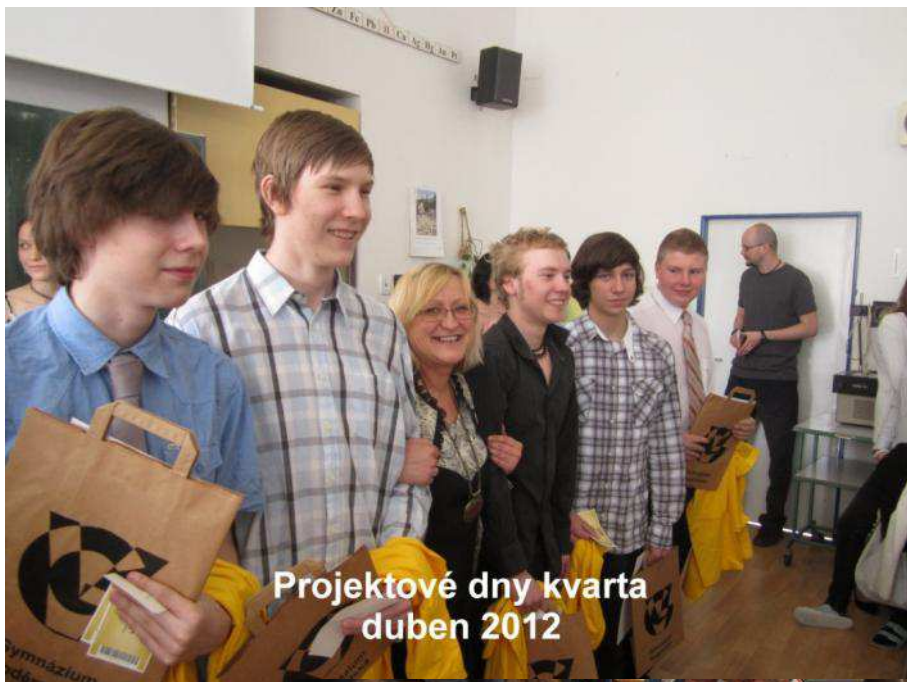
Projektové dny kvarta duben 2012