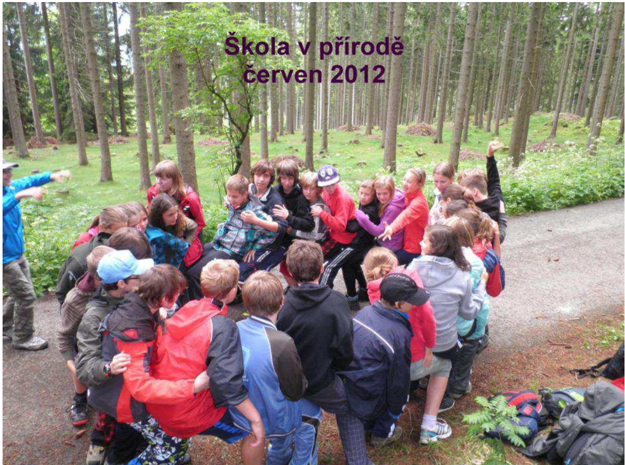
Škola v přírodě červen 2012