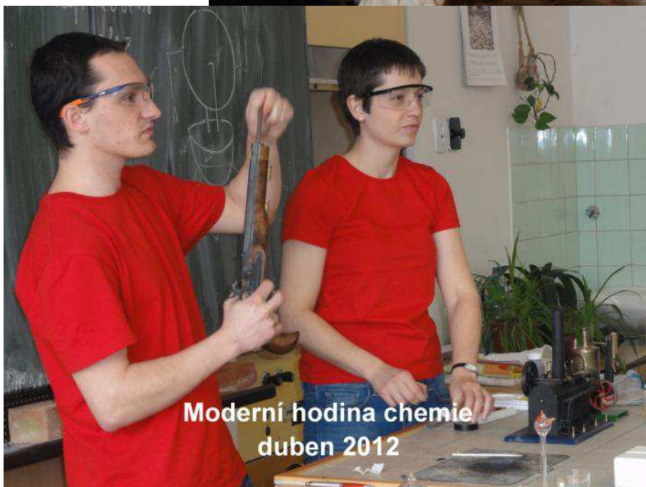
Moderní hodina chemie duben 2012