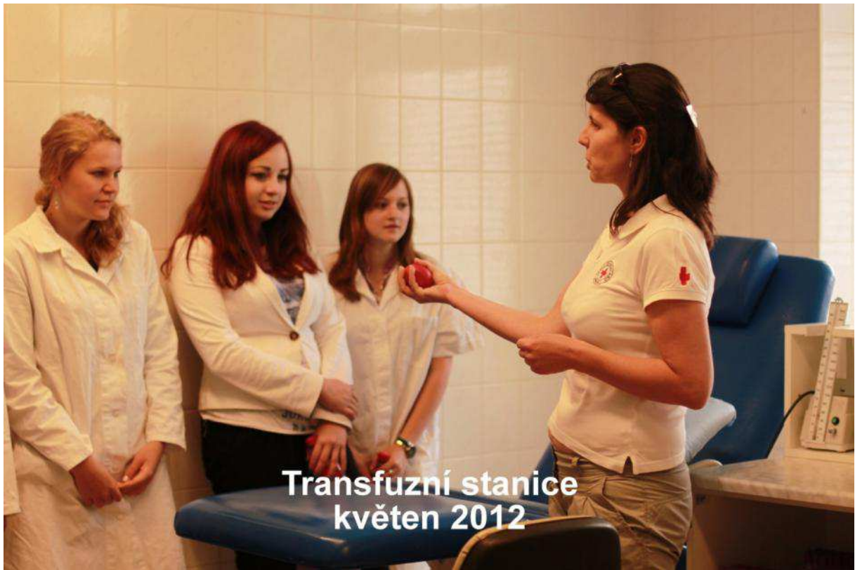
Transfuzní stanice květen 2012