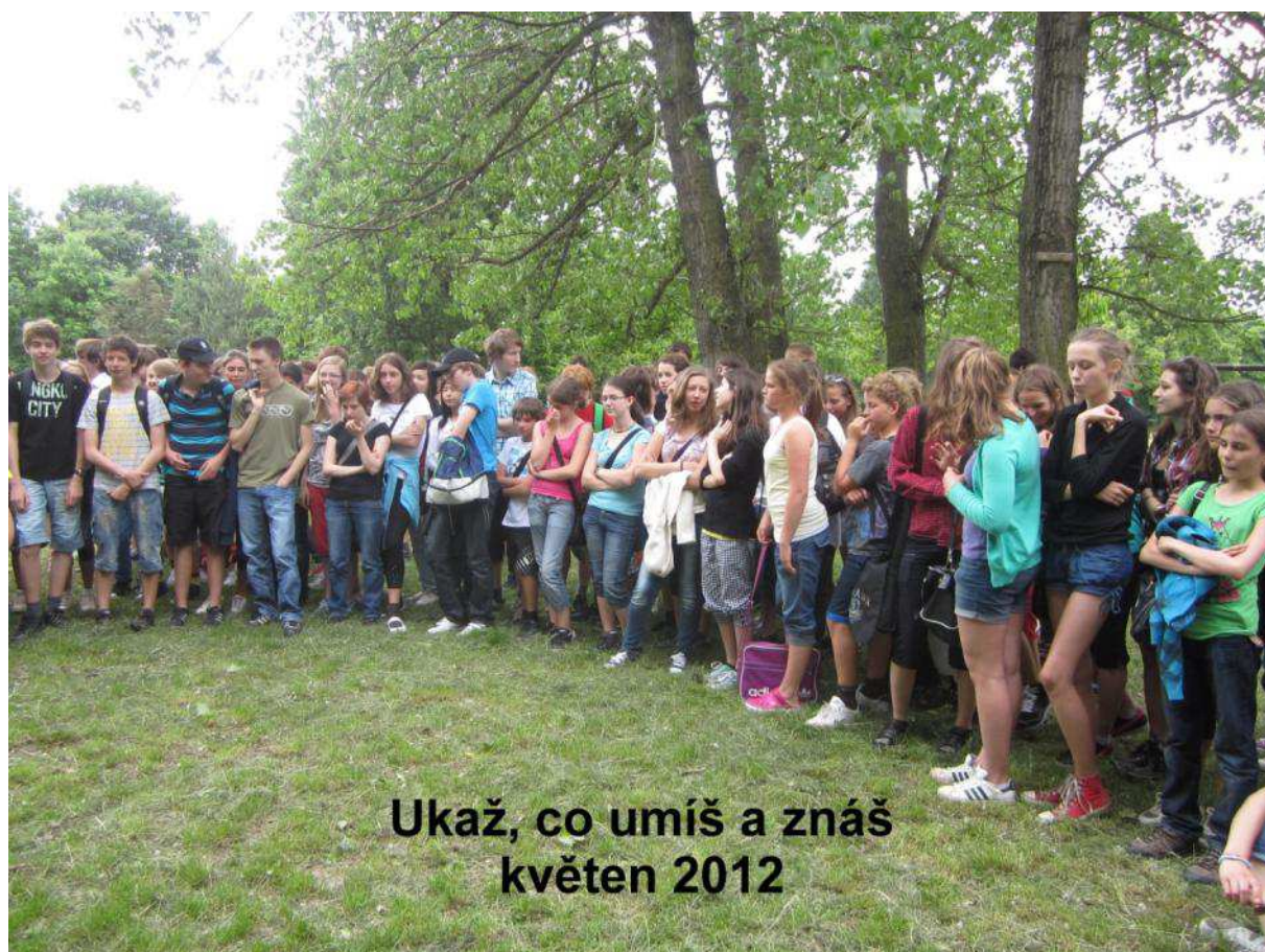
Ukaž, co umíš a znáš květen 2012