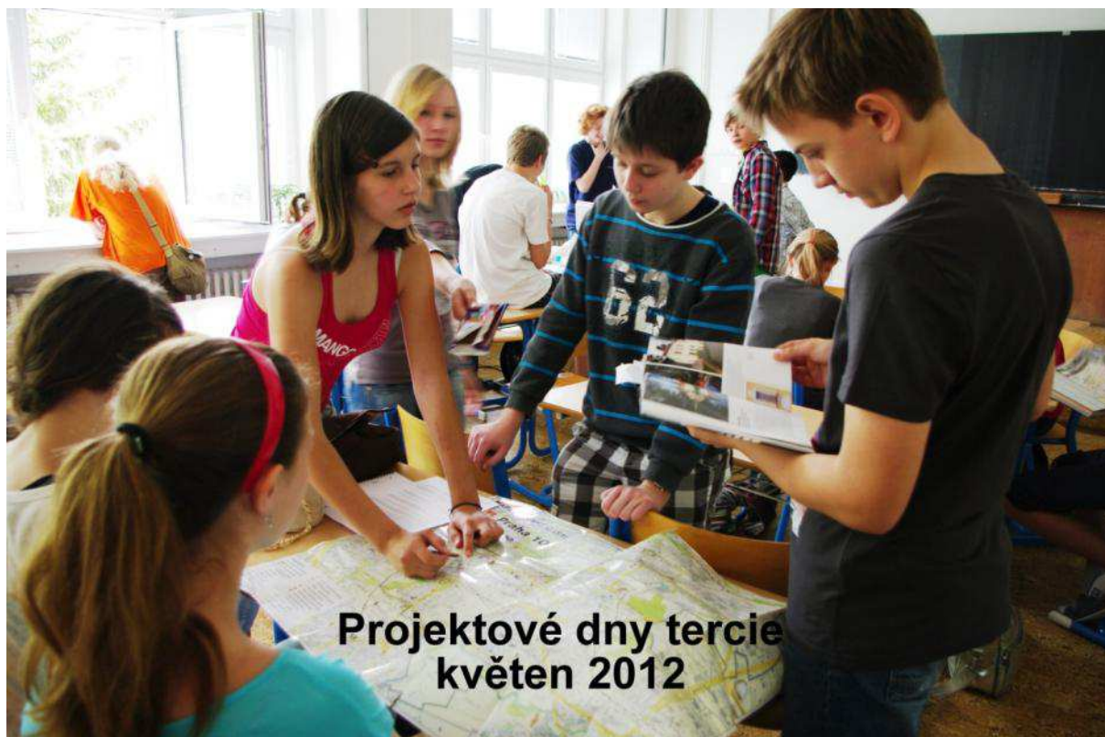
Projektové dny tercie květen 2012