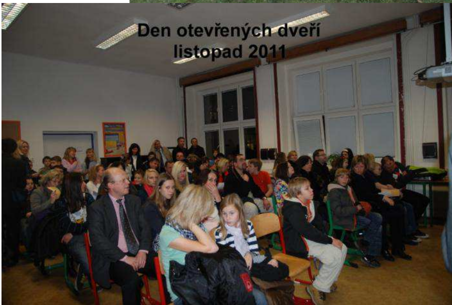
Den otevřených dveří listopad 2011