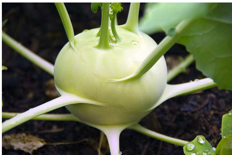
Stonková bulva kedlubny