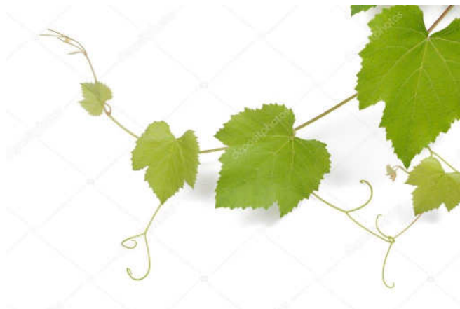
Úponky vinné révy